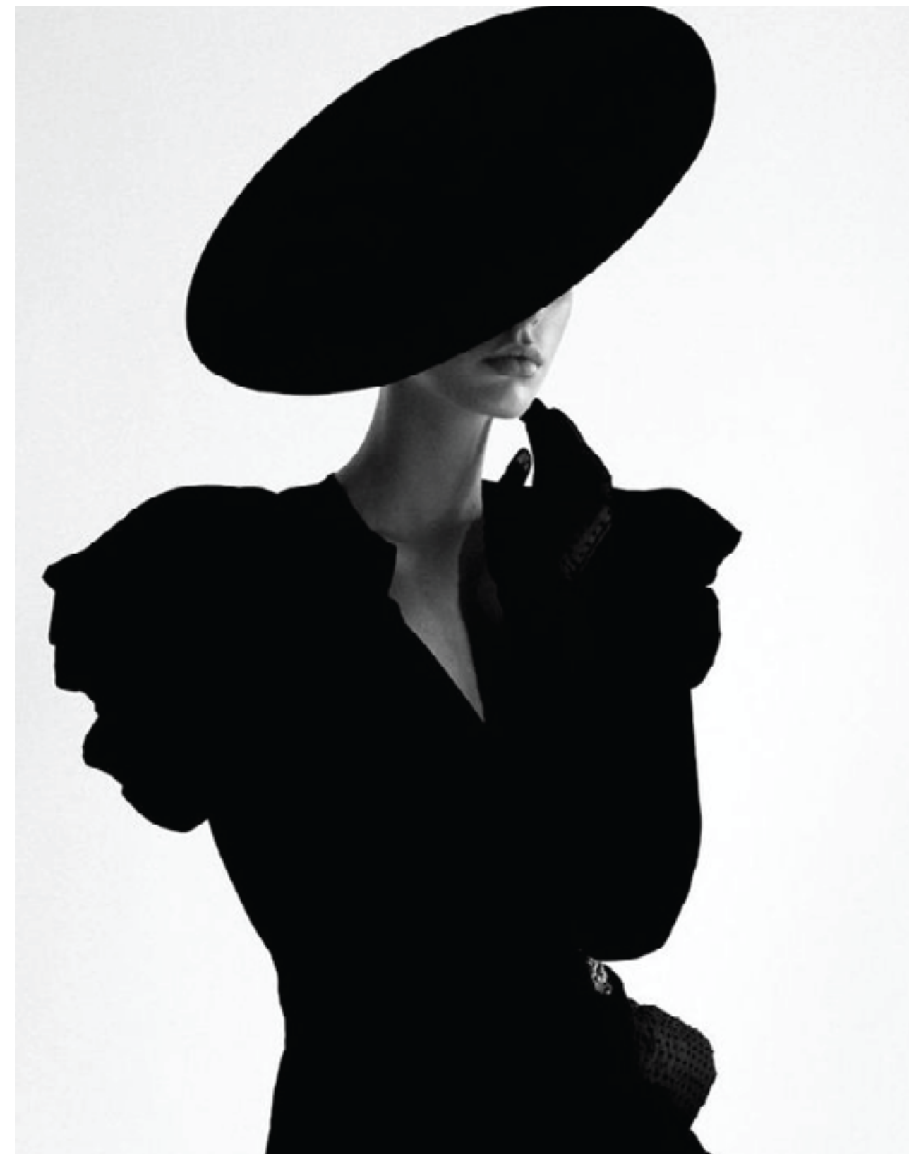
PROPUESTA PROYECTO LIAISON 2024