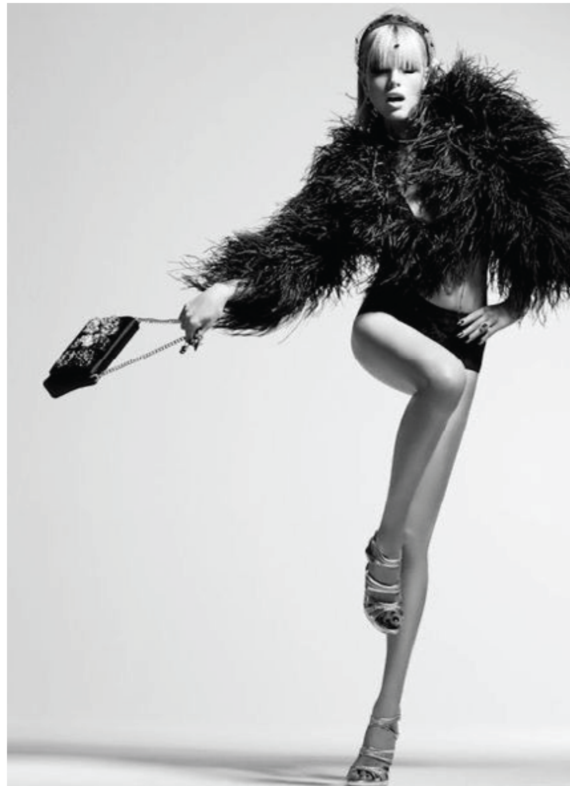
PROPUESTA PROYECTO LIAISON 2024