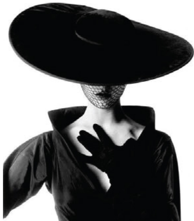
PROPUESTA PROYECTO LIAISON 2024